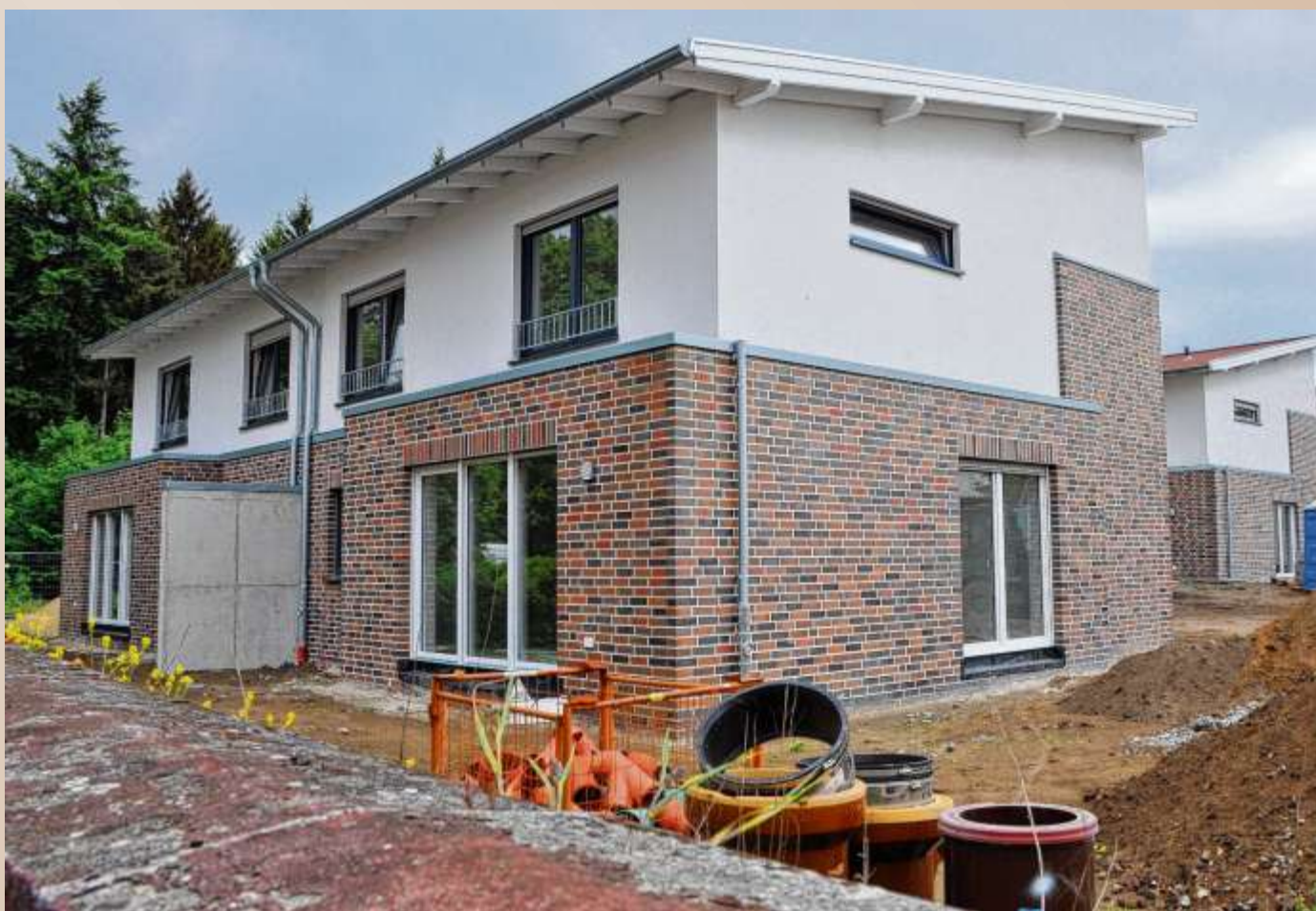
Gebäude stehen bereit: Die ersten Bewohner ziehen jetzt an der Bahnhofstraße ein. Die letzten Arbeiten am Außengelände sind derweil noch nicht abgeschlossen.